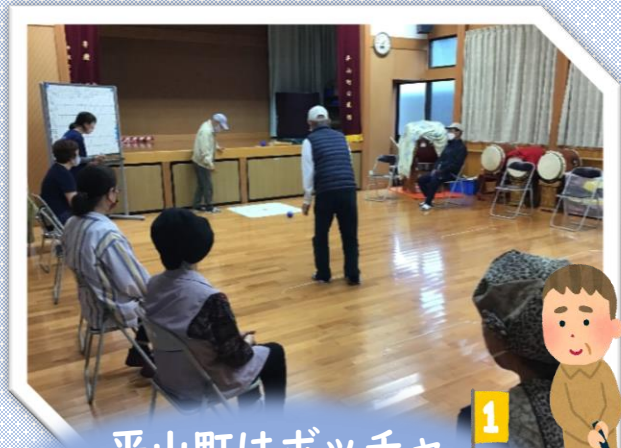
平山町はボッチャ で楽しく介護予防