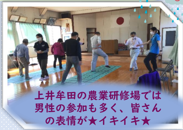
上井牟田の農業研修場では 男性の参加も多く、皆さんの 表情が★イキイキ★