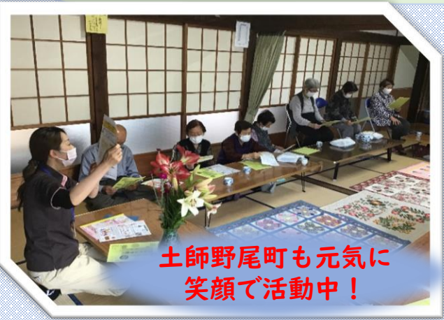
土師野尾町も元気に 笑顔で活動中！