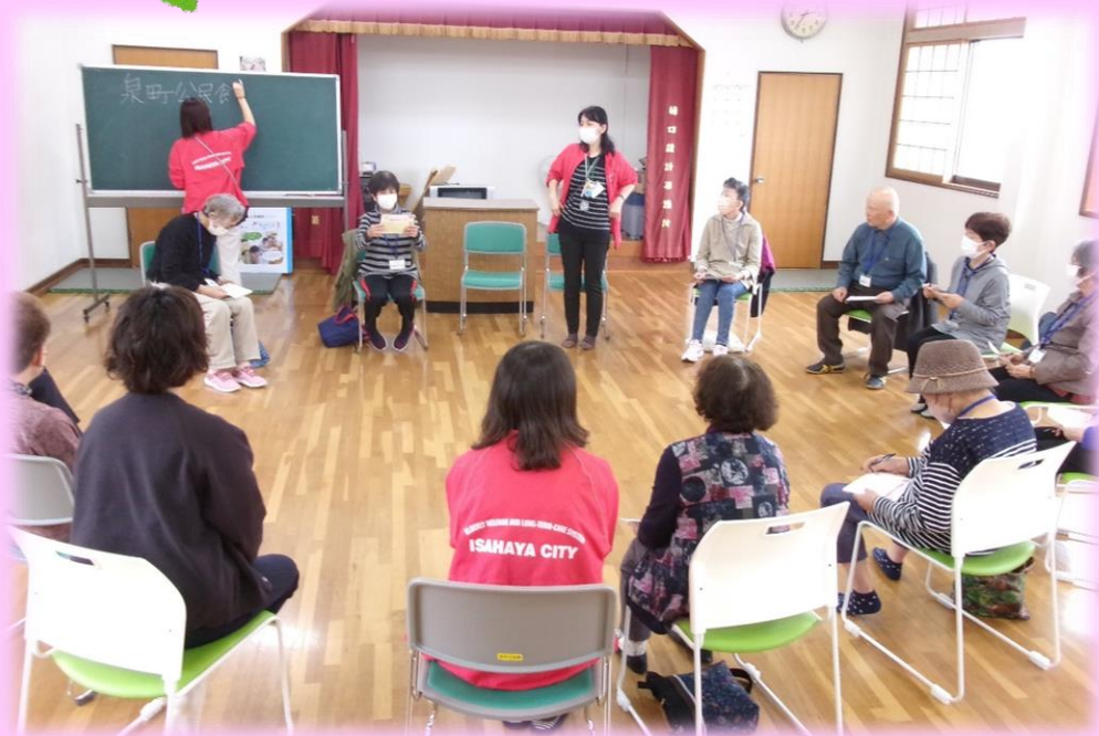
輪になって会場ごとにスローガンを決めました。