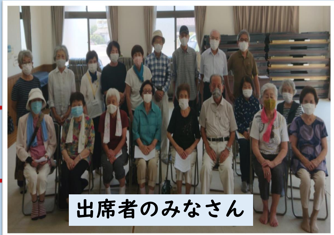
出席者のみなさん